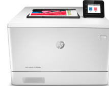
HP Color LaserJet Pro M454dw

Cette imprimante a été conçue pour fonctionner uniquement avec des cartouches disposant d'une puce HP neuve ou réutilisée. Elle est équipée d'un dispositif de sécurité dynamique pour bloquer les cartouches intégrant une puce non-HP. Les mises à jour périodiques du micrologiciel permettent d'assurer l'efficacité de ces mesures et bloquent les cartouches qui fonctionnaient auparavant. Une puce HP réutilisée permet d'utiliser des cartouches réutilisées, reconditionnées ou recyclées. Plus d'informations sur: http://www.hp.com/learn/ds