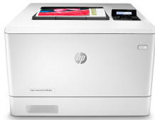
HP Color LaserJet Pro M454dn

Le secret de la réussite d'une entreprise : travailler intelligemment. L'imprimante HP Color LaserJet Pro M454 est conçue pour vous laisser vous consacrer aux tâches assurant la croissance efficace de votre entreprise et vous permettant de rester en tête de la concurrence.